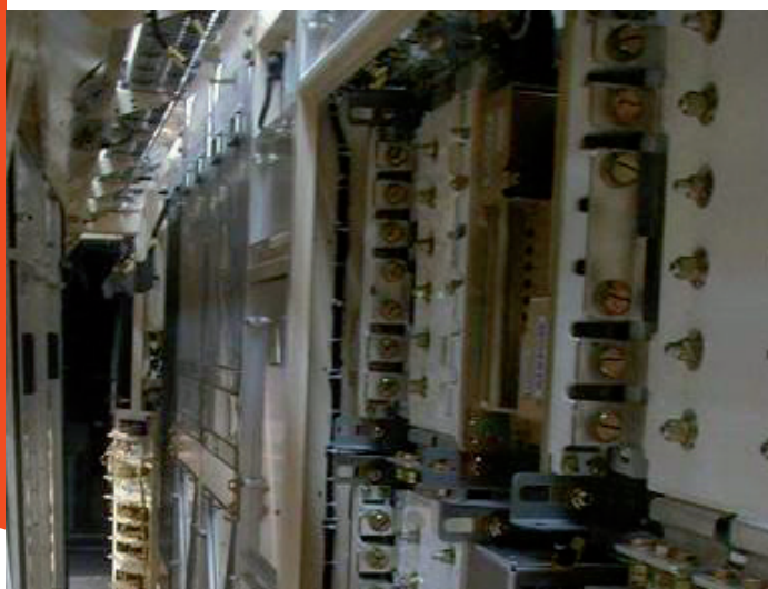
Chaîne de traction .....